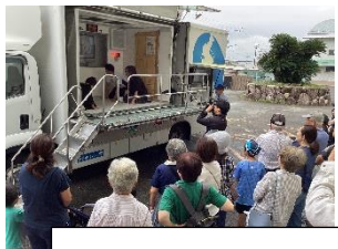
起震車による地震体験