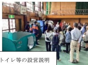
非常用トイレ等の設営説明