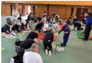
AED・心肺蘇生法の体験