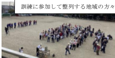
訓練に参加して整列する地域の方々